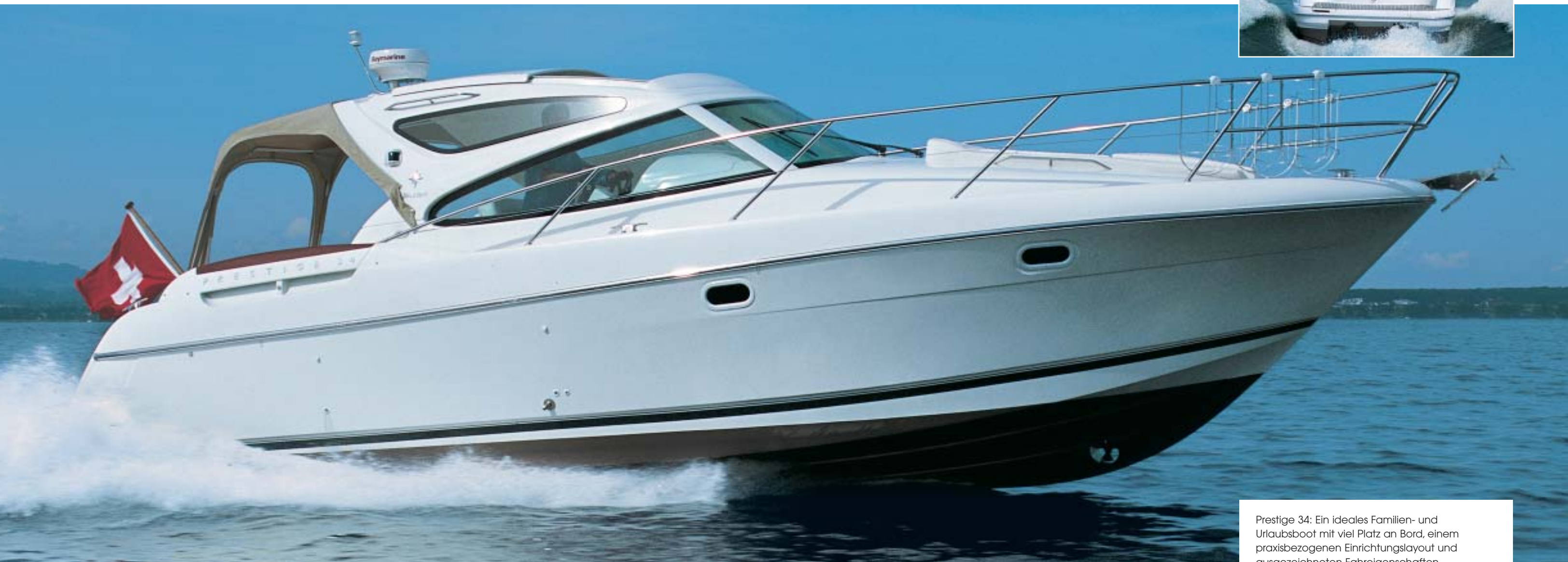
Prestige 34: Ein ideales Familien- und Urlaubsboot mit viel Platz an Bord, einem praxisbezogenen Einrichtungslayout und ausgezeichneten Fahreigenschaften.