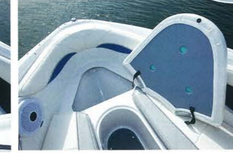
Während vorn Passagiere und Anker Platz finden (o.), lädt die Sonnenliegefläche im Heck zum Relaxen beim Ankern ein. Der iPod-Anschluss (kl. Bild) befindet sich im Bordschapp

re fehlen, präsentiert sich unser Testschiff des Modelljahrs 2011 in dieser Hinsicht vorbildlich: Fünf solide gearbeitete Handgriffe bieten genug Haltemöglichkeiten für alle Passagiere, sogar vorne auf den tief angelegten Sitzen im Vordeck.