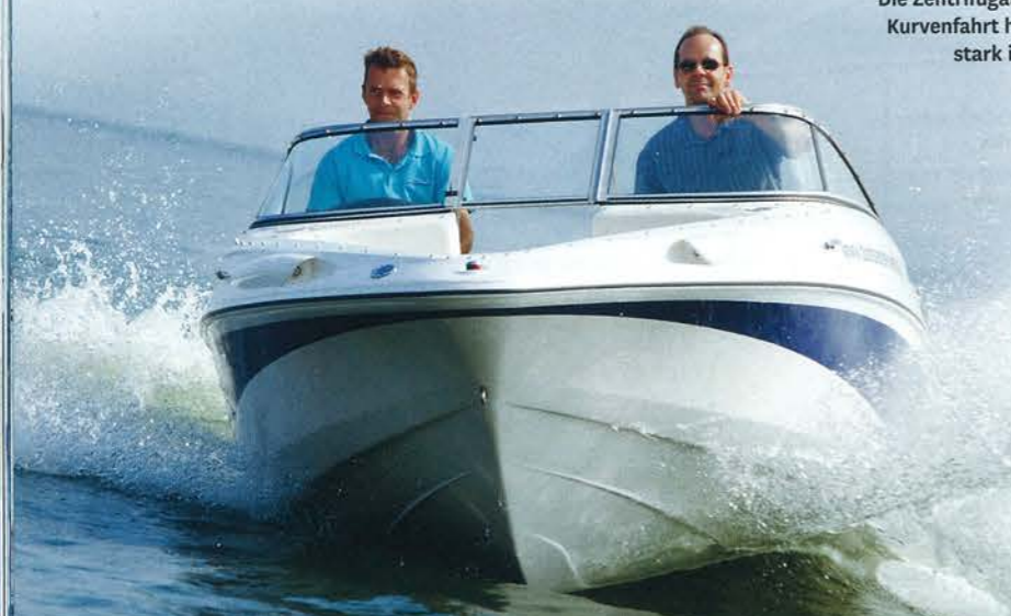
Die Zentrifugalkräfte bei Kurvenfahrt halten sich stark in Grenzen

Das Tempomaximum erreicht der Bowrider – Avanti, Allante! – bei 5.000 Umdrehungen und 41,7 Knoten. Außerhalb unserer Messfahrt war das fabrikneue Boot auch 42,2 Knoten schnell. Selbst bei hohem Tempo wirkt der Rumpf wie an die Wasseroberfläche montiert, die Fahrt mit dem 1.312 kg schweren Sportboot läuft entsprechend ruhig und sicher. Die Zentrifugalkräfte bei Kurvenfahrt halten sich stark in Grenzen, und auch